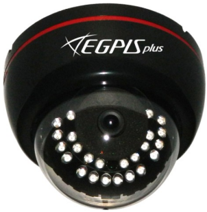
CASE 색상 : BLACK